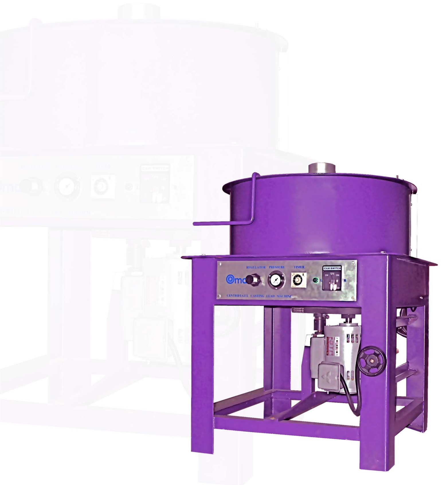
Centrifugal Casting Machine For Lead เครื่องหล่อเหวียง งานตะกั่ว