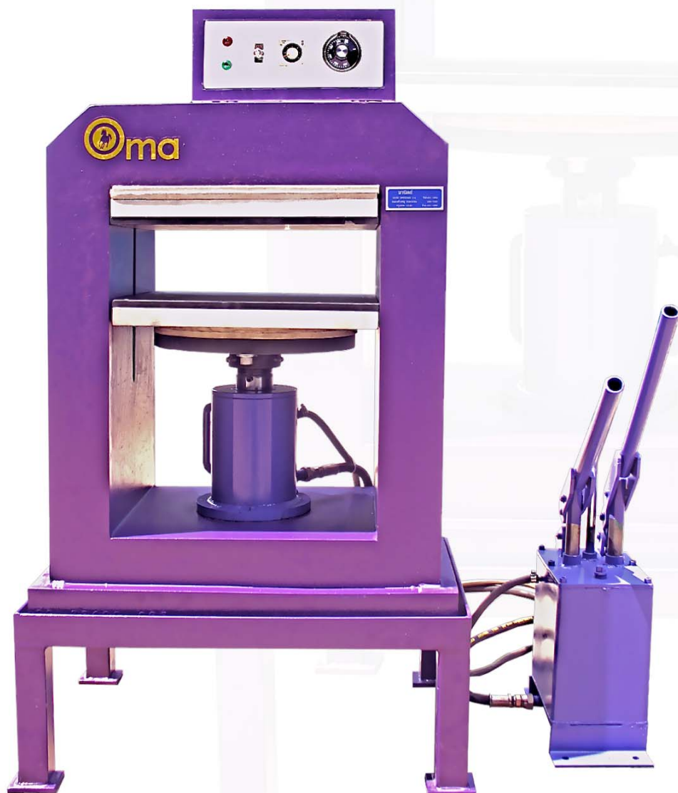
Vulcanizer Machine For Lead Mold เครื่องอัดยางสำหรับงานตะกั่ว